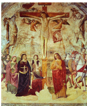
Salita al Calvario

Questo ciclo di affreschi è stato restaurato nel 1954 da Arturo Raffaldini, mentre un nuovo restauro è stato attuato negli anni 1981- 1991 da Ottorino Nonfarmale 10 .