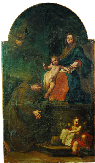
La Madonna col Bambino e s. Francesco Assisi, 1754

Francesco Caccianiga (Milano, 1700 – Roma, 1781) Olio su tela