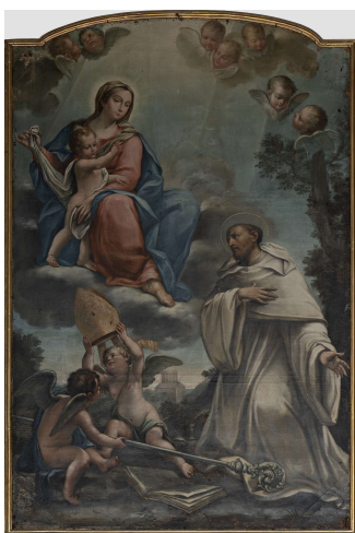
La Vergine appare a San Bernardo

Grazie ad un restauro degli anni novanta, le due tele principali delle cappelle laterali hanno mostrato una firma sulla parete retrostante, prima non visibile per il loro essere inserite all'interno di un'elaborazione a stucco: "PINXIT/ ANTONIUS/ FANZARESIUS/ FOROLIVIENSIS/ 1750". Partendo da questa indicazione, l'intero ciclo pittorico è stato attribuito al forlivese Antonio Fanzaresi, attivo in Romagna e in Toscana nel XVIII secolo.