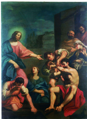
La resurrezione di Lazzaro