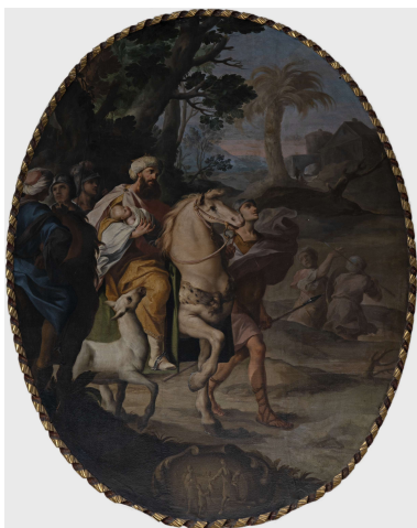
Sant'Onofrio infante portato nel deserto dal padre Re di Persia

Nel 2018, in occasione del centenario della morte del famoso aviatore, il feretro è stato esposto all'interno dell'Oratorio, come già avvenuto nel 1968, in occasione del cinquantenario della morte di Francesco Baracca.