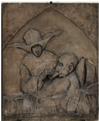
La monaca e l'infermo, 1964

La cappella, pur essendo uno spazio liturgico all'interno dell'ospedale, riflette le radici storiche dell'assistenza sanitaria a Cesena: la città vanta una lunga tradizione di istituzioni benefiche e assistenziali, documentata fin dal XIV-XV secolo con le prime strutture ospedaliere e consolidata nei secoli successivi. In questo contesto, l'intervento di Masacci e Gallingani non rappresenta soltanto un abbellimento formale, ma una riflessione artistica e spirituale sulla cura e sulla compassione, capace di parlare, attraverso forme e materiali moderni, ai pazienti, agli operatori sanitari e ai visitatori di oggi.