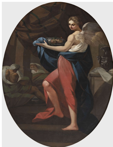
L'arcangelo Raffaele assiste gli infermi

All'interno della chiesa si conserva inoltre un ciclo pittorico dedicato agli episodi della vita di San Giovanni di Dio, fondatore dell'ordine dei Fatebenefratelli, che gestivano l'ospedale di Faenza, eseguito da Filippo Comerio tra il 1777 e il 1778. Il ciclo comprende due grandi tele centinate sulle pareti laterali del presbiterio e quattro ovali distribuiti lungo le pareti dell'unica navata. Partendo dalla nascita del santo, sulla parete di destra si trovano i primi due episodi che precedono la fondazione dell'ospedale di Granada; la narrazione prosegue sulla parete di sinistra con eventi legati all'attività assistenziale del santo e si conclude con la sua morte. Tutti e sei i dipinti sono inseriti in cornici di scagliola con ornamenti a festoni fitomorfi in stucco bianco e dorato, attribuiti allo stesso Comerio, che contribuiscono a unificare l'insieme pittorico e architettonico della chiesa.