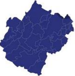
Tabella comuni Cesena