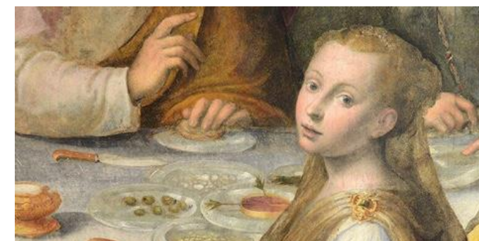
Luca Longhi "Le nozze di Cana"