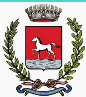
Comune di Bagnacavallo

SERVIZIO SANITARIO REGIONALE EMILIA-ROMAGNA Azienda Unità Sanitaria Locale della Romagna