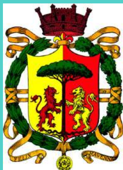
Comune di Ravenna Assessorato al decentramento Consiglio Territoriale Ravenna Sud