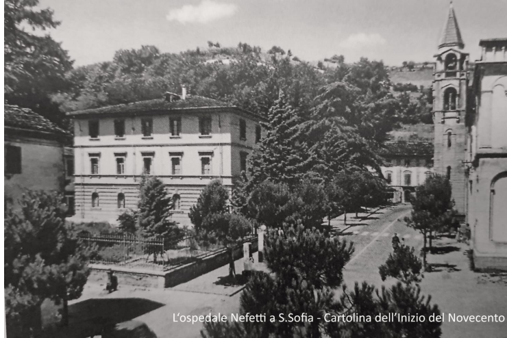
L'ospedale Nefetti a S.Sofia - Cartolina dell'Inizio del Novecento